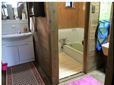
洗面・脱衣・浴室