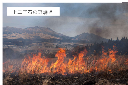
上二子石の野焼き