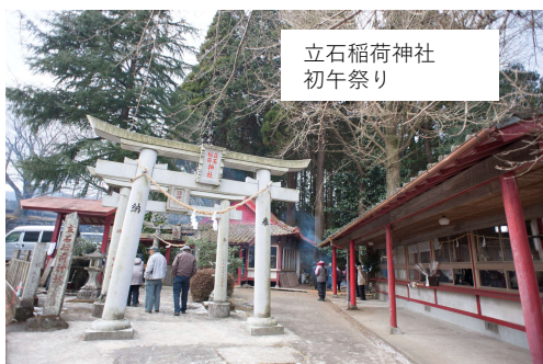
立石稲荷神社 初午祭り